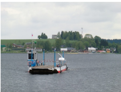
Fähre Lipno Stausee

Abfahrt: Donnerstag 05. Mai 2016 09:00 Uhr BP Tankselle Puchenau Rottenegg > Eschlberg > St. Johann am Wimberg > Helfenberg > Guglwald > Pasecna > mit der Fähre über Lipno See > Cerna Posumavi > Arnostov > Smedec > durch den Nationalpark Chko Blansky > Kremze > 156 nach Strazkovice > Trhove Sviny (Schweinitz) > Zar > Svebohy > Benesov > Kaplice > Horni Dvoriste > Deutsch Hörsclag > Zulissen > Reichenthal > Hirschbach > Ottenschlag > Alberndorf > Abschluß bei „Goggi“ Mirellenstüberl Tageskilometer ca. 260