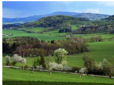
Nationalpark Chko Blansky Les