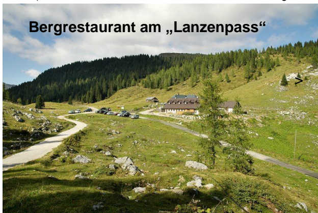
Bergrestaurant am „Lanzenpass“

Sonntag: 30.09. Hermagor > B87 Greifenburg > B100 Linz > Winklarn > Mölltal > Mallnitz > Tauernschleuße > Bad Gastein > Bischofshofen > 159 Hallein > Wiestal > Ebenau > Thalgau > Mondsee > Loibichl > Oberwang > auf der A1 bis Linz / Ansfelden KM 350